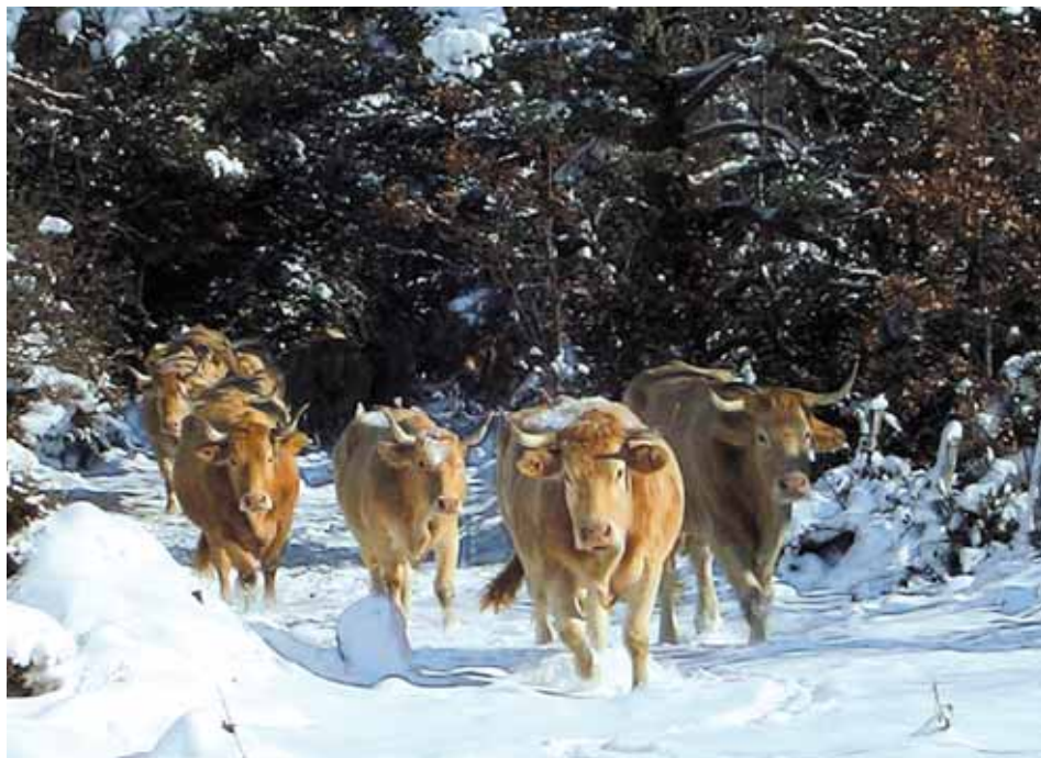
Animales de la Raza Pirenaica en terreno nevado.