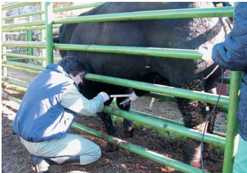
Extracción de semen por electroeyaculación.

El personal dispondrá de aseos y de una fuente potable de agua, así como productos para su limpieza y un botiquín sanitario.