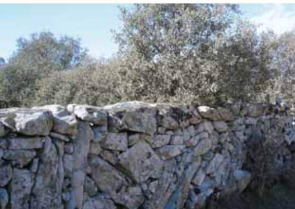
Cerca tradicional de piedra.

Los cercados en vacas nodrizas suelen ser de tipo fijo, conectados o no a hilos eléctricos. Deben estar correctamente fijados y mantenerse intactos procediendo siempre que sea necesario a su reparación ya que la finalidad es tanto evitar que los animales salgan de la extensión vallada, o como la intrusión de otros animales.