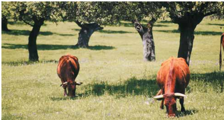
Animales de la Raza Retinta pastando en campo.

ción del pasto con 4-6 meses de edad y aproximadamente 200 Kg de peso. Con este sistema es necesario conservar parte del forraje primaveral para consumirlo durante el otoño-invierno.