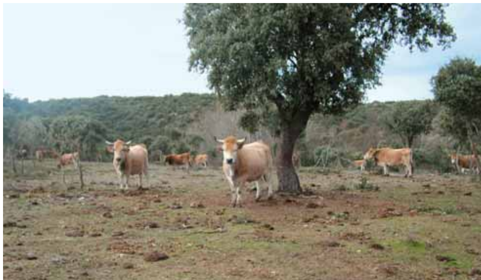
Explotación en extensivo en debesa de vacas nodrizas de la raza asturiana de la montaña.

adecuadas, siempre en la época adecuada para realizarlo.