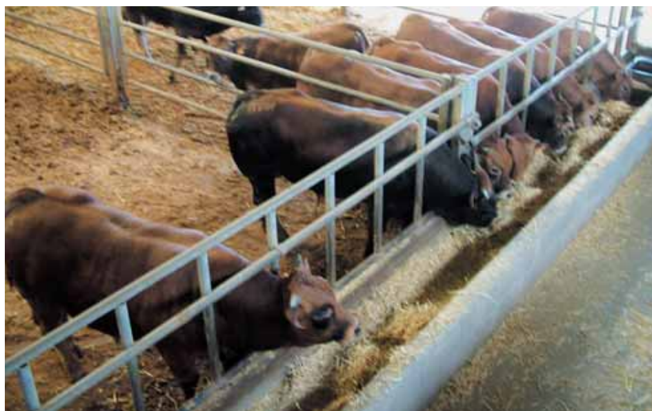
Novillos de la raza asturiana de los valles en cebaderos.

El ganadero responsable deberá tener experiencia y ser competente en las técnicas de partos, y deberá prestar especial atención a la higiene, en particular en el caso de partos asistidos. Deberá cerciorarse de que la vaca podrá lamer al ternero inmediatamente después del parto.