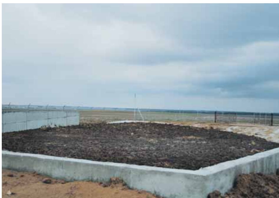
Estercolero con fosa de lixiviados.