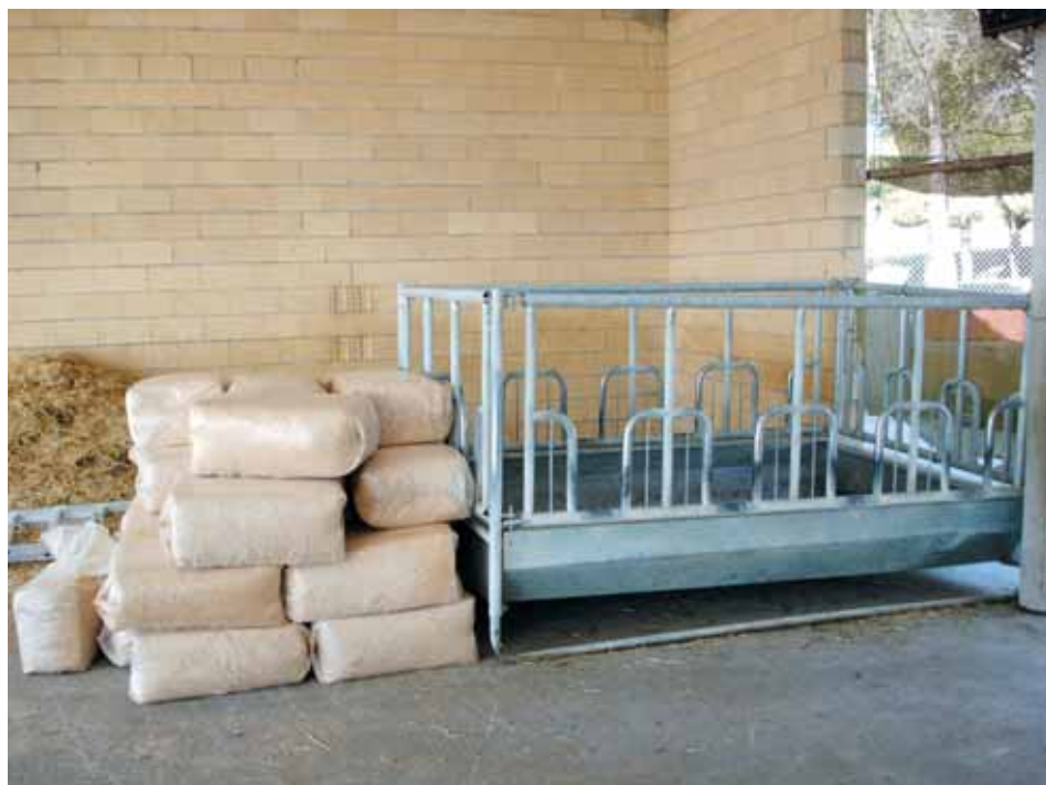
Sacos de pienso medicamentoso almacenados.

Solamente los profesionales con la cualificación y formación adecuada tendrán acceso a este botiquín y podrán administrar los medicamentos a los animales.