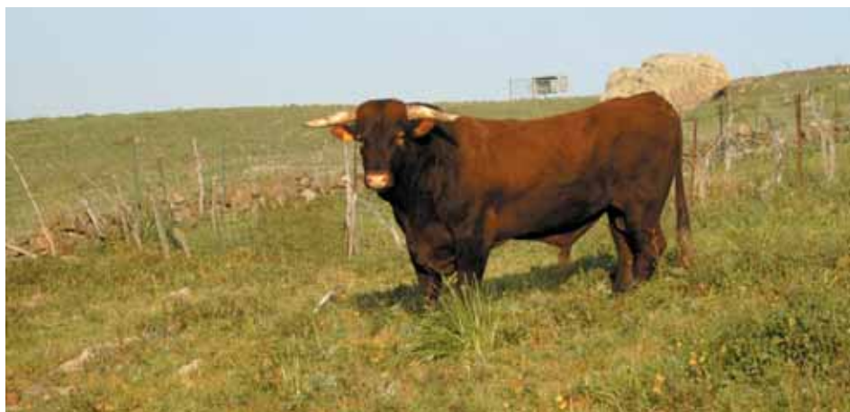
Retinto con verja.