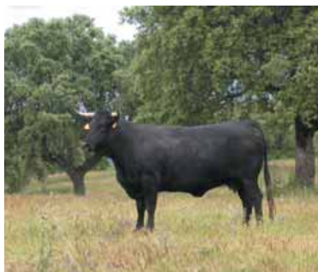
Avileña Negra Ibérica en la dehesa.

durante los meses más duros del invierno se les complementa la alimentación con forrajes y piensos. En este grupo de vacas destacan las razas autóctonas españolas (Avileña-Negra Ibérica, Asturianas, Morucha, Retinta, y Rubia Gallega) aunque también existen razas importadas como la Charolesa y