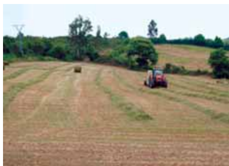
Hierba recién segada para henificar.