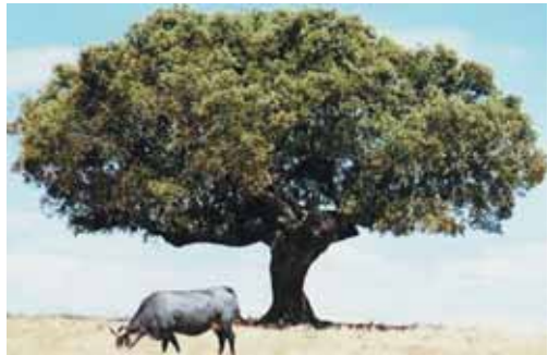
Ejemplar de Morucha pastando al pie de una encina.

Debe prestarse especial interés a la hora de calcular las densidades gana-