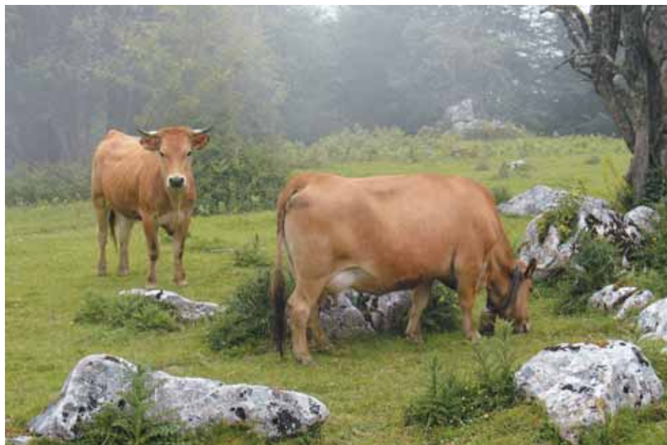
Ejemplares de razas asturianas.

Como en general, no se conocen ni la disponibilidad de los minerales en el