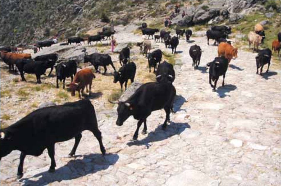
Ganadería de la Raza Avileña - Negra Ibérica realizando la trashumancia.

Los animales se manipularán y transportarán separadamente en los siguientes casos: