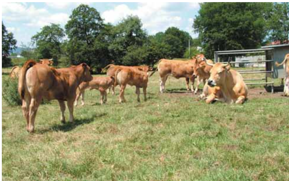
Explotación ganadera de la Raza Asturiana de los Valles

Las vacas nodrizas suelen encontrarse en explotaciones que cuentan con una base territorial bastante importante y normalmente en regímenes claramente extensivos, en los que tan sólo