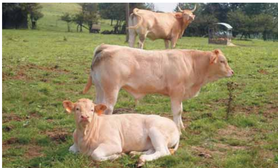
Animales de la Raza Pirenaica.

En estas zonas los partos se agrupan a finales del invierno climatológico para sincronizar la lactación con la máxima producción de hierba. Los terneros se destetan al final del período de produc-