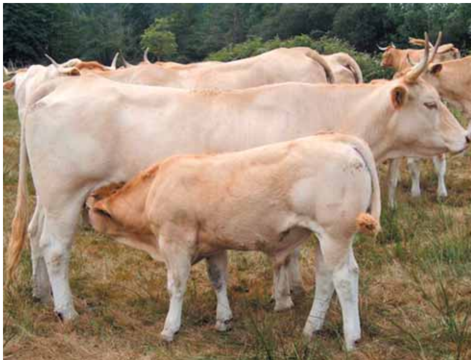
Vaca Pirenaica con ternero.