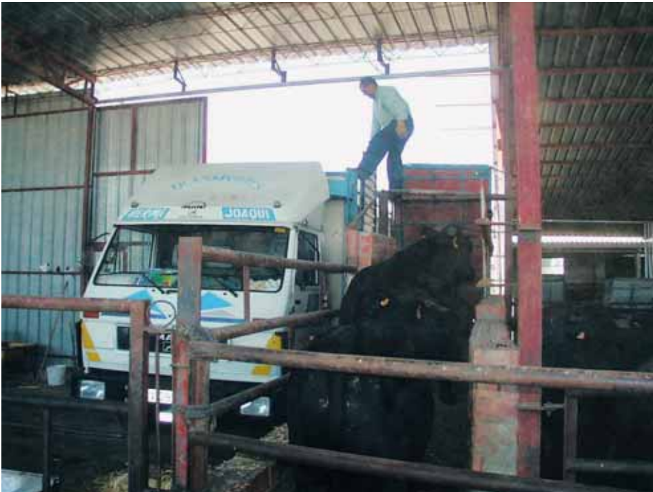
Carga de animales en la explotación.

Los medios de transporte, los contenedores y sus equipamientos deberán diseñarse, construirse, mantenerse y utilizarse de modo que sea posible: