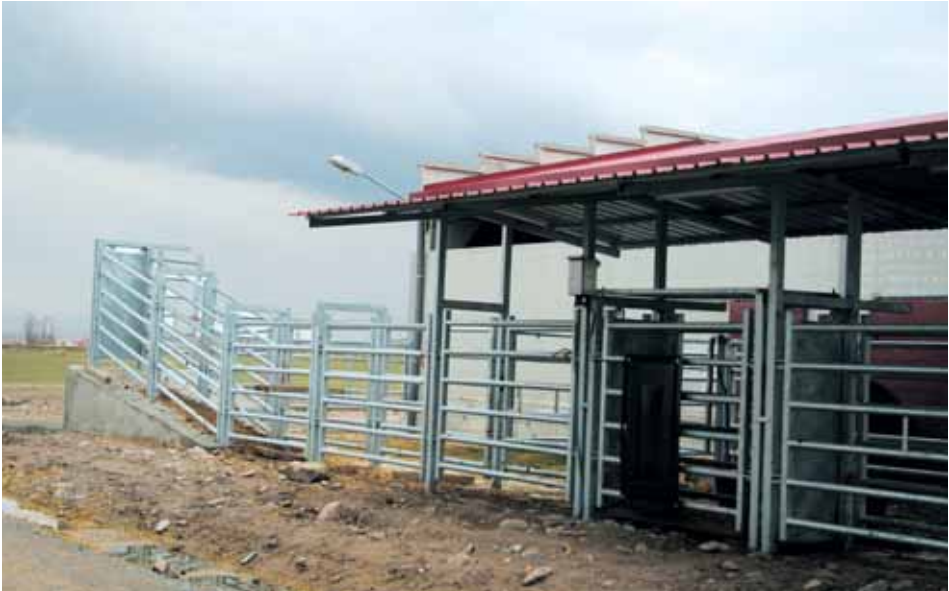
Manga de manejo.

Parideras: En el caso de ganado de reproducción, deberán preverse compartimentos para el parto. El lugar estará aislado, será tranquilo y siempre estará en disposición de una cama limpia y seca, donde no deberán existir restos de los partos anteriores.