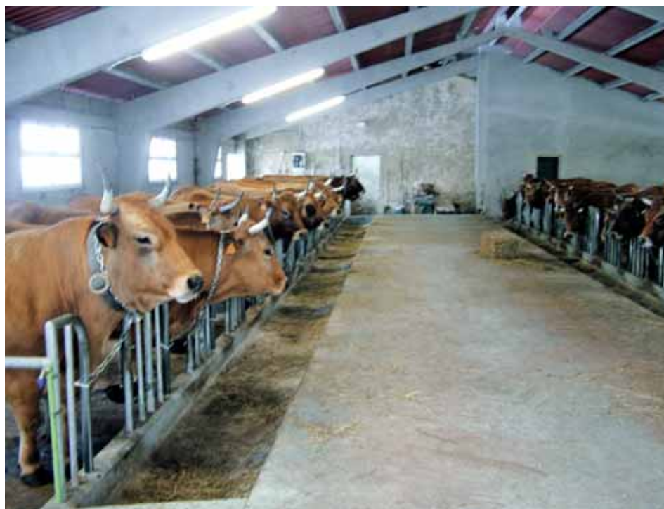
Explotación de la raza Asturiana de los Valles.

Lazareto: Se deberá disponer de un alojamiento apropiado para tratar a los animales enfermos o heridos a fin de que se les pueda separar o, llegado el caso, aislar. Deberá estar situado en unas zonas aisladas, bien orientadas y apartadas del resto de los animales en un lugar especialmente tranquilo.