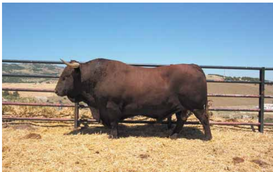
Semental de la Raza Retinta.

Los toros deberán poder hacer suficiente ejercicio.