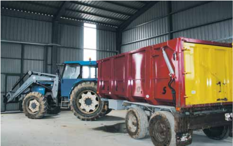
Tractor de trabajo.

Cuando un animal muere en la explotación, debe separarse del resto