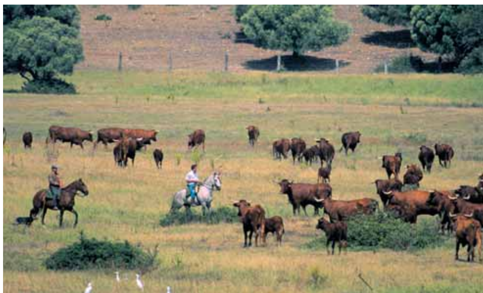
Vacada de animales de la Raza Retinta con vaqueros a caballo.

En el caso de los productores que estén sujetos a programas de certificación de producto, como en ganadería ecológica, Indicación Geográfica Protegida (IGP) o los pliegos de etiquetado