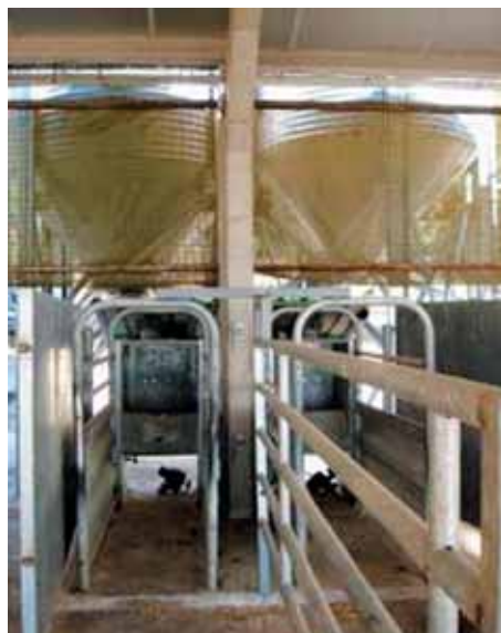
Comedero biplaza para animales estabulados.

En los animales en explotaciones con periodos de estabulación, estos pueden estar atados ocupando cada uno de ellos su correspondiente plaza de amarre, la cual va provista de comedero y bebedero. En estos casos, los comederos suelen ser lineales, proporcionando a cada plaza una longitud de comedero comprendida entre 1 y 1,20 metros. Se recomienda poner un bebedero de cazoleta para cada dos vacas contiguas.