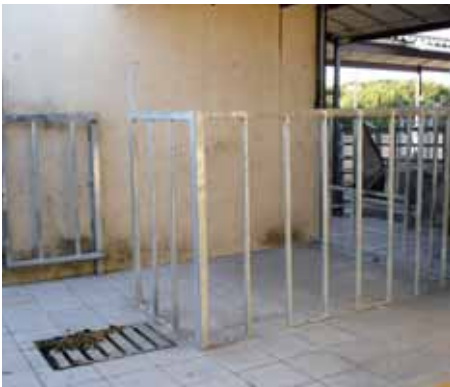
Lazareto o boxer individual.

Henil y almacén: Deberá estar próximo a la nave de los animales, para de esta forma facilitarnos el trabajo, aunque lo suficientemente aislada para