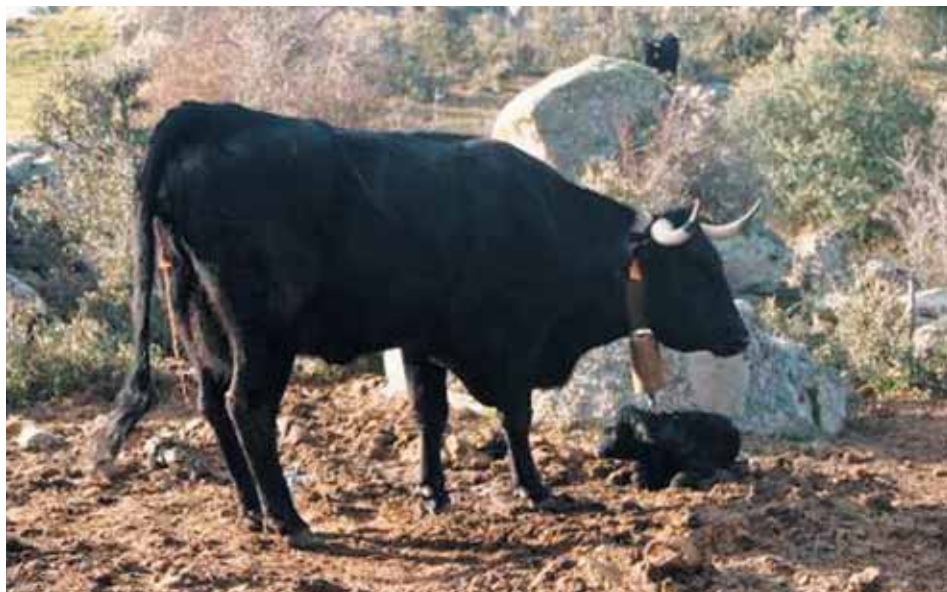
Animal recién parido.