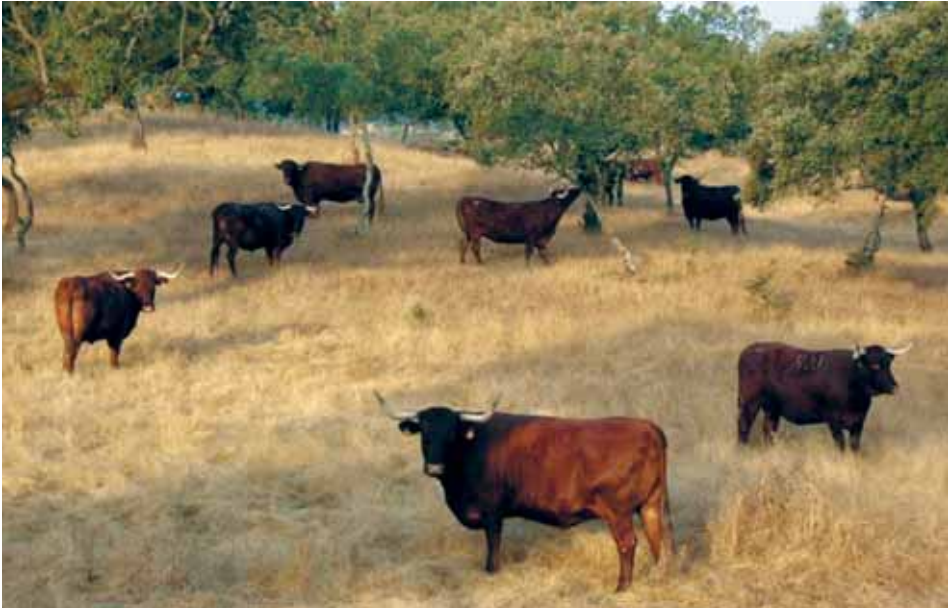
Vacas Retintas en ramoneo.

Comerse los animales las hojas y las puntas de los ramos de los árboles es bastante frecuente una o dos veces al año, utilizándose este sistema para cubrir períodos de necesidades del ganado, cuando no hay otros recursos pastables. Se suelen usar la encina, el fresno y algunas retamas de otras especies.