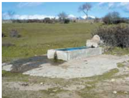
Bebedero en campo.