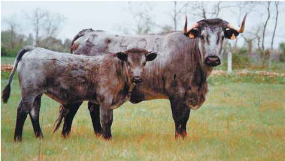
Vaca con cría de la Raza Morucha.

El ganadero deberá cerciorarse de que el ternero recién nacido reciba