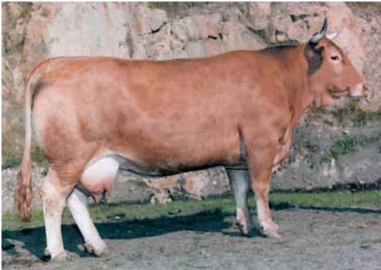
Hembra de la raza rubia gallega.