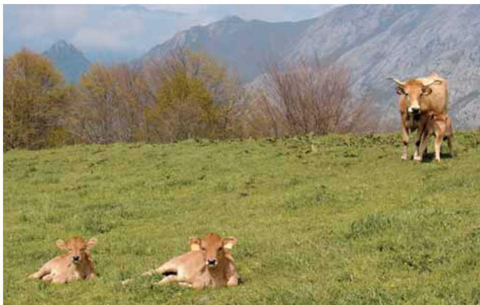
Terneros y vaca de la raza asturiana de la montaña.

El ternero nace desprovisto de defensas, por lo que la ingesta de calostro en las primeras horas de vida resulta vital para conferirle inmunidad pasiva frente a agentes patógenos.