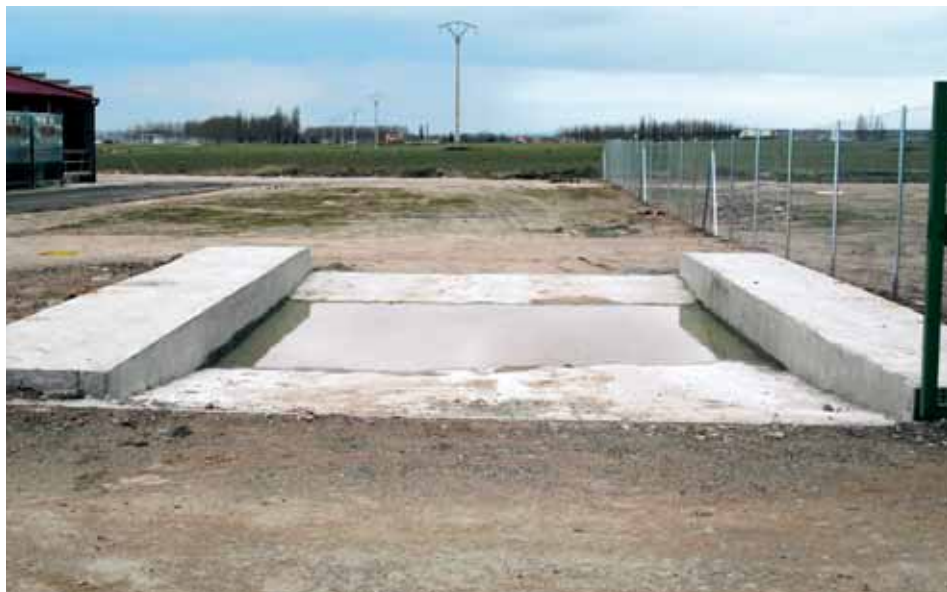
Acceso a una explotación.

se, construirse y mantenerse de forma que guarden buenas condiciones de higiene, limiten los riesgos de enfermedades o de lesiones traumáticas para los animales y que respeten las condiciones de seguridad necesarias en materia de prevención y protección contra incendios.