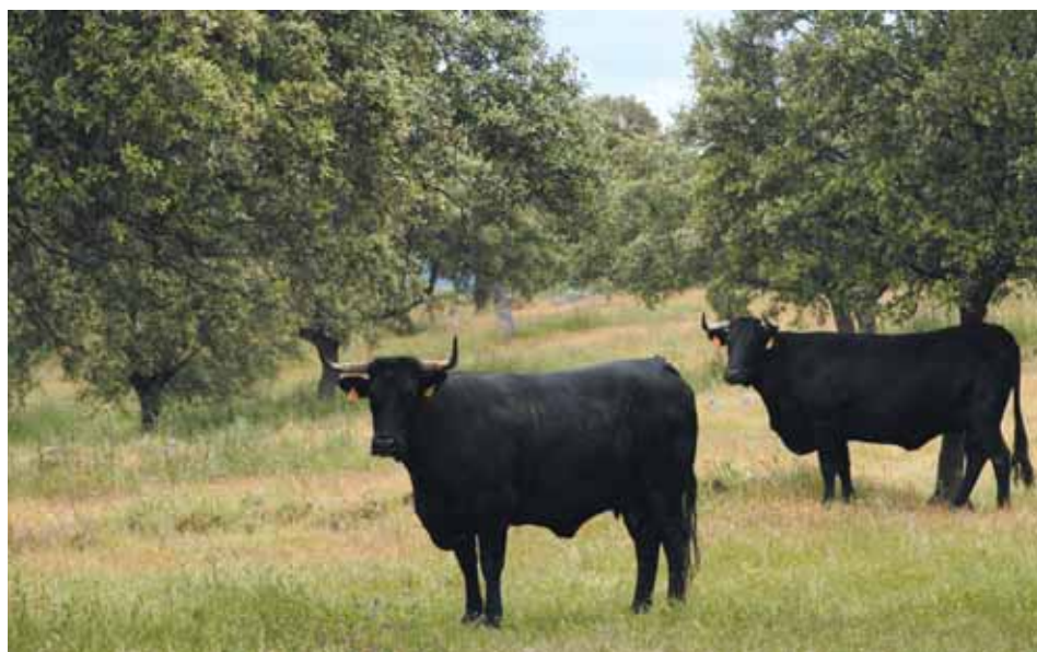
Ejemplar de la Raza Avileña - Negra Ibérica en campo.

La longitud del compartimento deberá ser tal que el animal pueda mante-