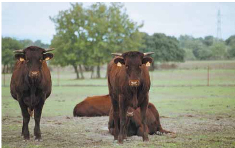
Novillas de la raza Retinta.

La vaca nodriza es un elemento clave a la hora de fijar la población, siendo, en muchas áreas, la única actividad económica sostenible posible. Su desaparición resultaría catastrófica para la población de todas estas zonas, y por tanto, para un espacio rural nor-