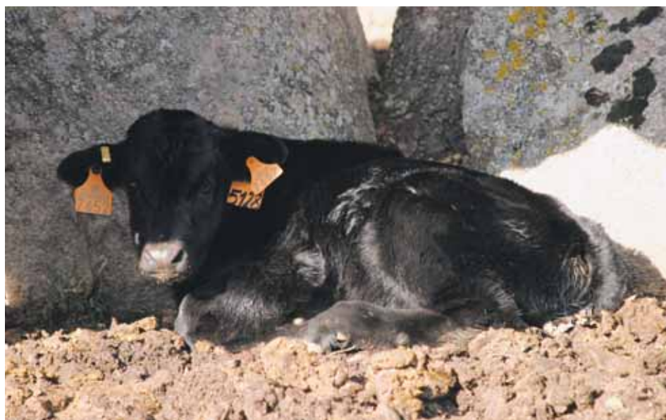
Animal identificado de la Raza Avileña-Negra Ibérica con pocos días de vida.

Los edificios y los equipos destinados al ganado bovino deberán diseñar-