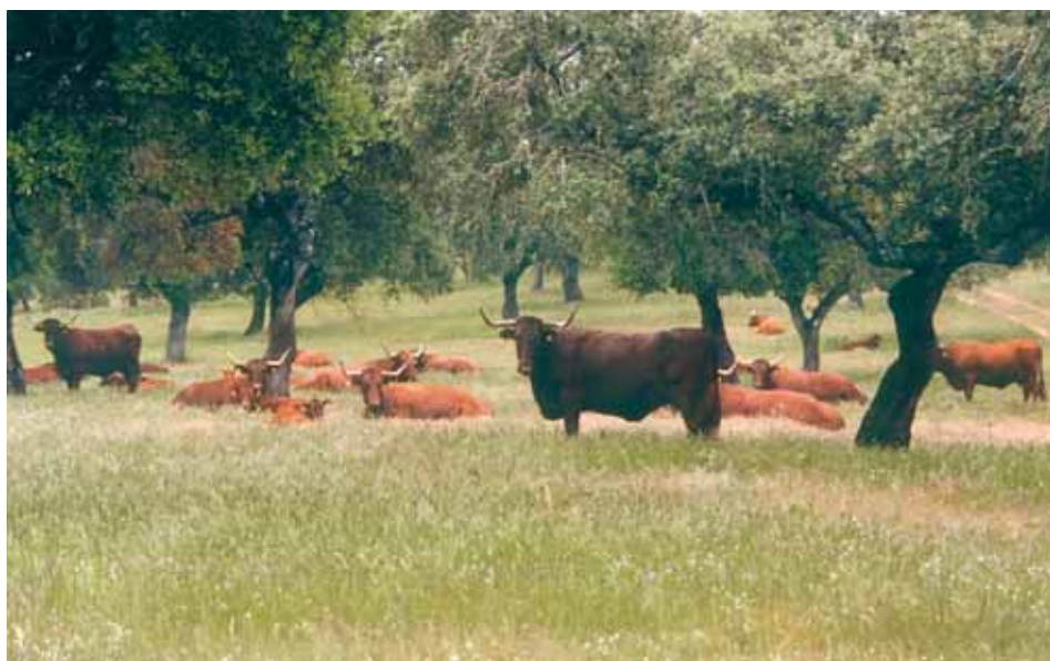
Animales de la Raza Retinta en extensivo.

Todos los animales deberán tener acceso apropiado a una alimentación suficiente, nutritiva, higiénica y equilibrada todos los días, así como a agua