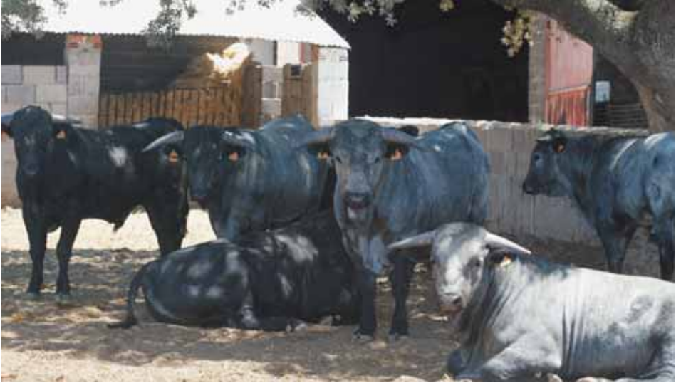
Beceros de la raza morucha en cebadero.

narse cuidadosamente, al menos dos veces al día.