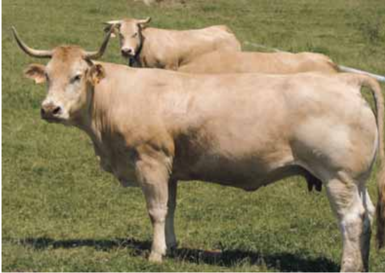
Ejemplar de la raza pirenaica.

transformación y distribución de un alimento, un pienso, un animal destinado a la producción de alimentos o una sustancia destinada a ser incorporados en alimentos o piensos o con probabilidad de serlo.