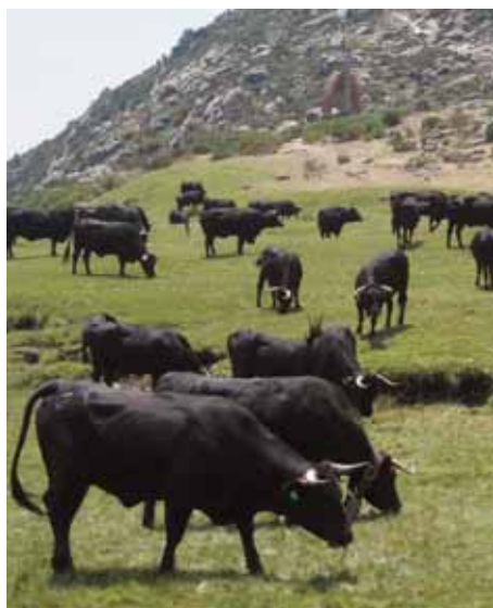
Ejemplares de Raza Avileña - Negra Ibérica pastando en el puerto del Pico.

Es importante considerar la pendiente de la explotación, en pendientes mayores al 15% no se deben realizar labores de volteo a una profundidad superior a los 25 cm, siempre siguiendo