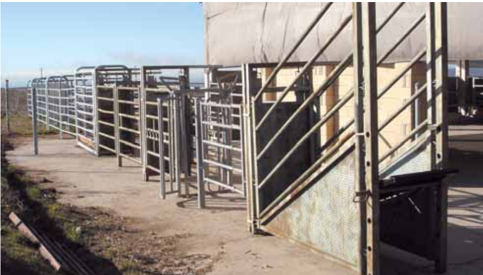
Manga de manejo.